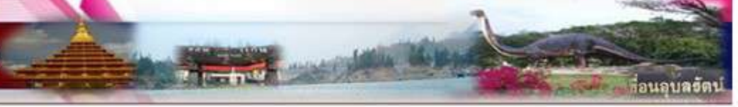
ก่อนอุบลรัตน์