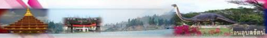
สวนอนุสรณ์